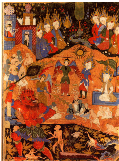
تصویر ۱۵: نقش ترازو در قضاوت واپسین، فالنامه طهماسی، دوره صفویه، منبع: (پوراکبر، ۷۸)