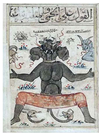
تصویر ۱: کتاب البلهان، دوره جلایریان، ۷۸۵ ق، بغداد