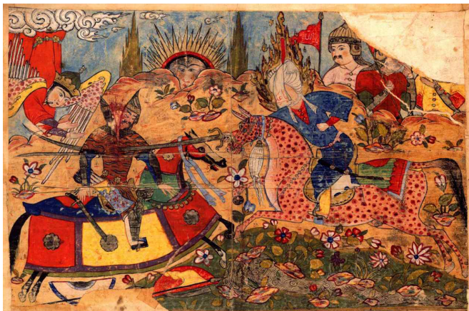
تصویر ۱۰: نقش خورشید در نگاره شقه‌کردن زید بن حسین، فالنامه طهماسبی، دوره صفویه، منبع: (پوراکبر، ۱۳)