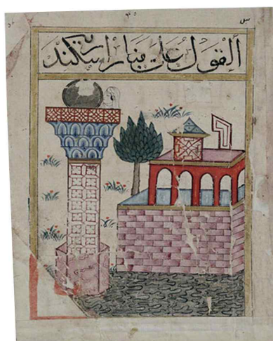
تصویر ۳: کتاب البلهان، دوره جلایریان، ۷۸۵ ق، بغداد