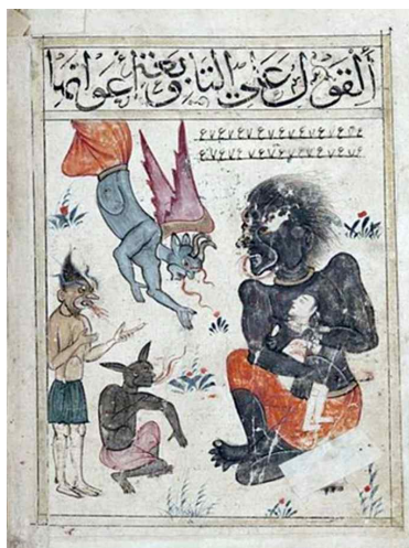
تصویر ۴: کتاب البلهان، دوره جلایریان، ۷۸۵ ق، بغداد