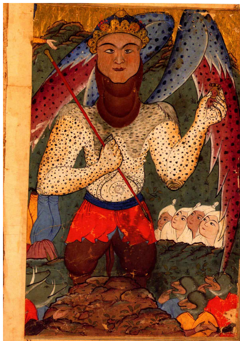
تصویر ۱۴: دابه الارض، فالنامه طهماسبی، دوره صفویه، منبع: (پوراکیبر، ۷۵)