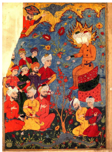
تصویر ۸: عید غدیرخم، فالنامه طهماسبی، دوره صفویه

ارادت شاه طهماسب به تشیع و به حضرت علی علیه السلام فرصتی را فراهم آورد تا نگارگران این دوره در فالنامه جایگاه این حضرت را والاترین حد قرار دهند. نکته جالب توجه در فالنامه طهماسبی مقام ارجحیت حضرت علی علیه السلام است که در جایگاهی برابر با حضرت محمد صلی الله علیه و آله و سلم در نگاره‌ها قرار گرفته است (تصویر ۸).