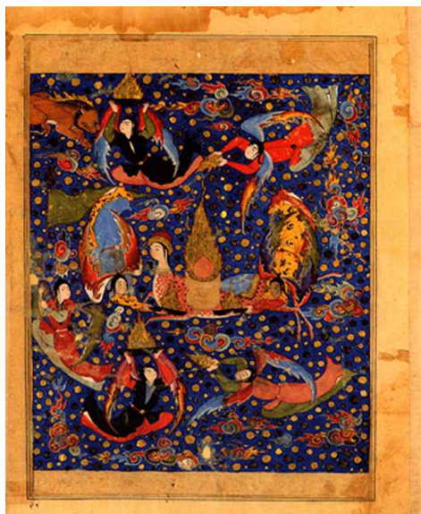
تصویر ۱۱: نقش شیر در نگاره معراج حضرت محمد صلی الله علیه و آله و سلم ، فالنامه طهماسبی، دوره صفویه، منبع: (پوراکبر، ۴۰)