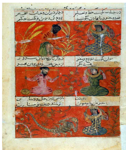
تصاویر ۵-۷: فال‌های فصل تابستان، پاییز، زمستان، مونس الأحرار، ۸۰۴ ق، شیراز