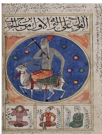
تصویر ۲: کتاب البلهان، دوره جلایریان، ۷۸۵ ق، بغداد