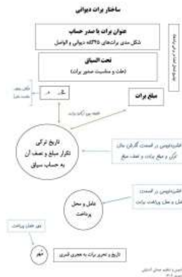
شکل شماره یک- ساختار برات دیوانی به خط شکسته نستعلیق و سیاق (منبع: عبدلی آشتیانی،

و محمدی، ۱۳۹۴، ص ۱۲-۱۳؛ عبدلی آشتیانی، ۱۳۹۵ ج ۲، ص ۸۷).