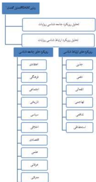
شکل شماره دو- مدل پیشنهادی رویکردشناسی ارتباطی گفتمانی رضوی- فطحیه